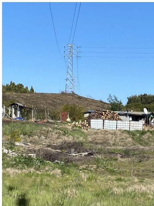
Ilustración 5. Bodega desmantelada bajo LT entre E15-E16