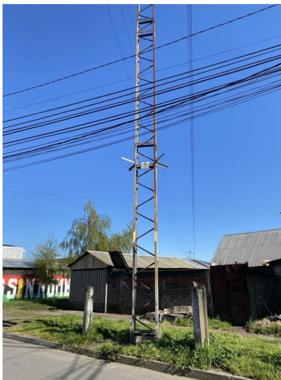
Ilustración 3. Construcción bajo LT entre E02-E03