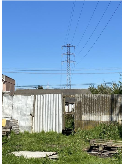
Ilustración 4. Construcción bajo LT entre E06-E07